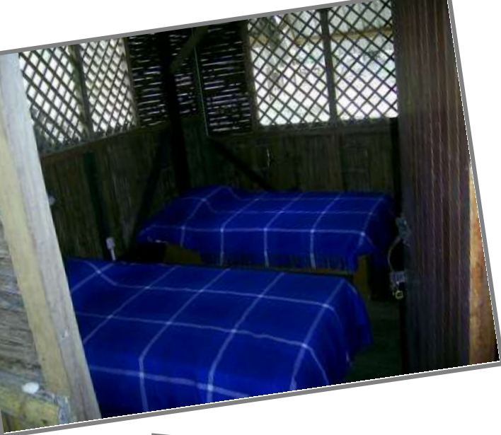
Úhledné pokoje s ortopedickým i matracemi a okenními sítěmi proti hmyzu