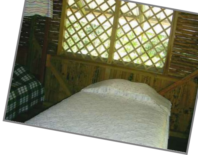
Místa pro odpočinek a šamanské rituály